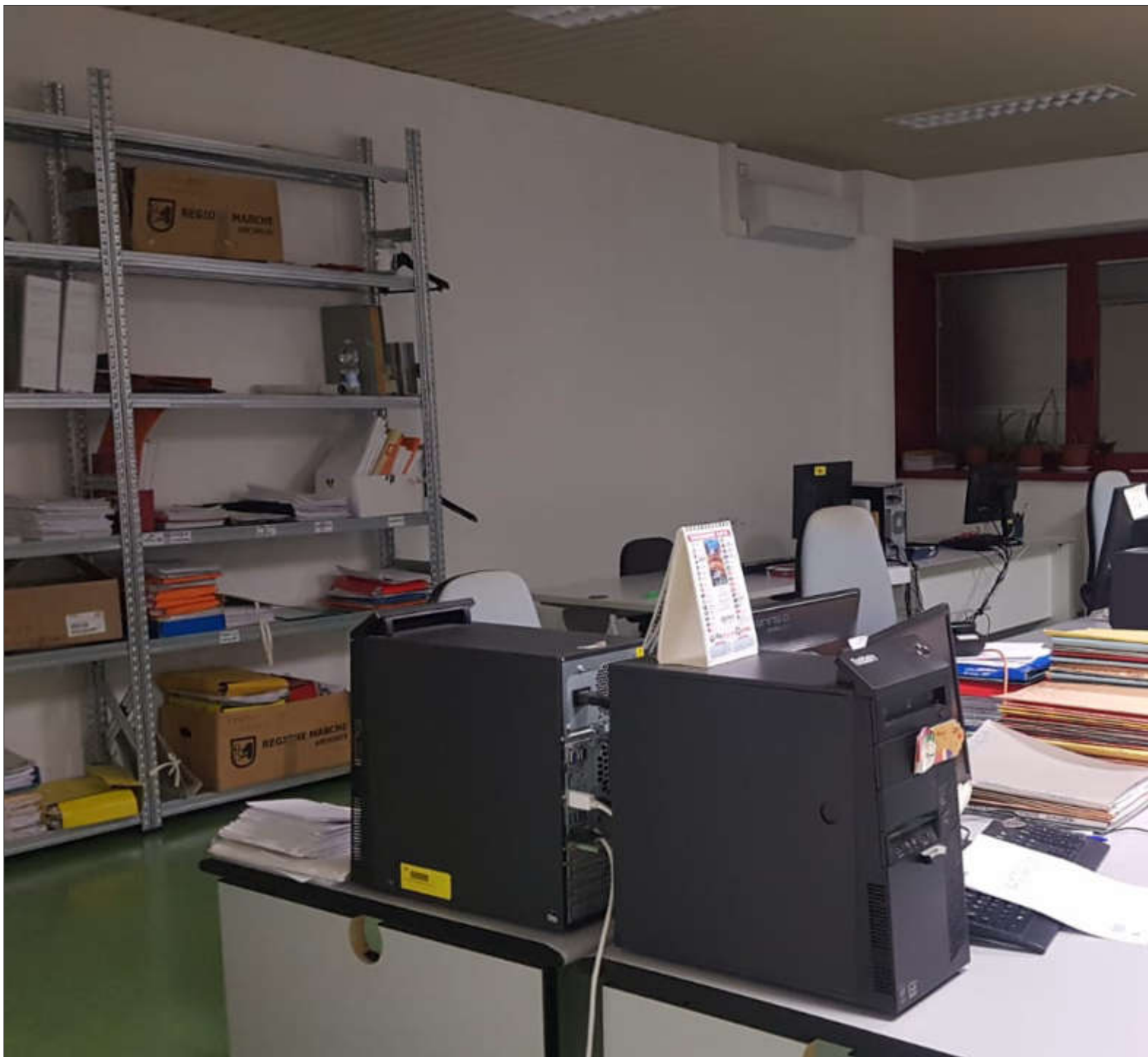
L'ufficio ricostruzione di Ascoli

Arrivano sullo smartphone gli aggiornamenti delle pratiche del terremoto. Si tratta di un servizio gratuito di informazione che consente di seguire l'iter di avanzamento della ricostruzione. I dati sono costantemente aggiornati dall'Usr (Ufficio Speciale per la Ricostruzione) in modo che tecnici e cittadini possano monitorare l'evoluzione riguardante gli immobili per cui è stata fatta richiesta di ripristino post sisma. E lo fa tramite messaggi inviati direttamente sullo smartphone dei cittadini attraverso l'App IO, la stessa utilizzata, ad esempio, per il cashback di Stato, per il Green Pass o per le notifiche dell'Inps.