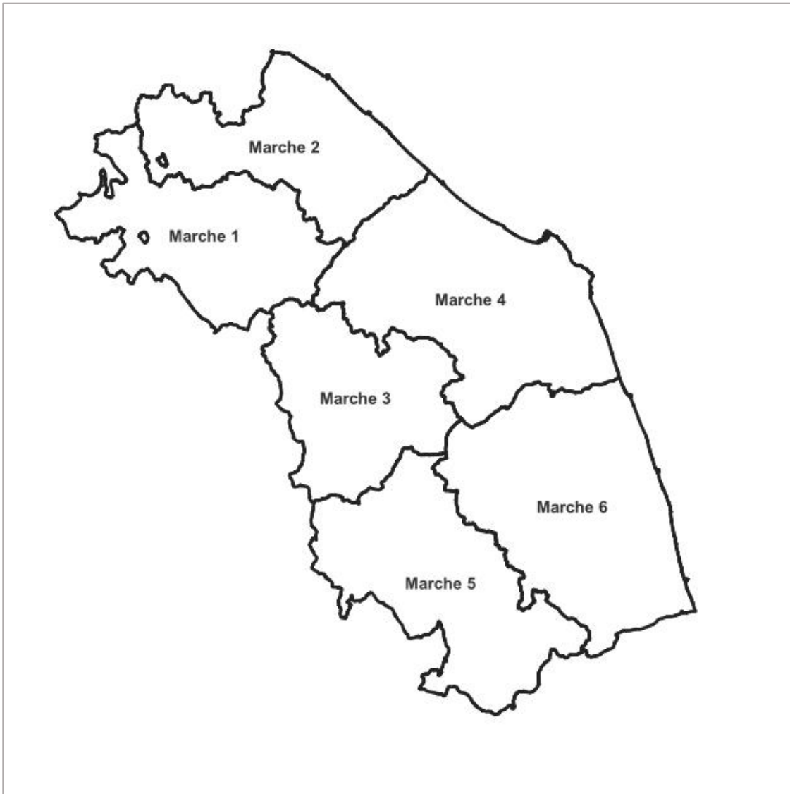
Figura 1. Zone di allerta per il rischio idrogeologico ed idraulico