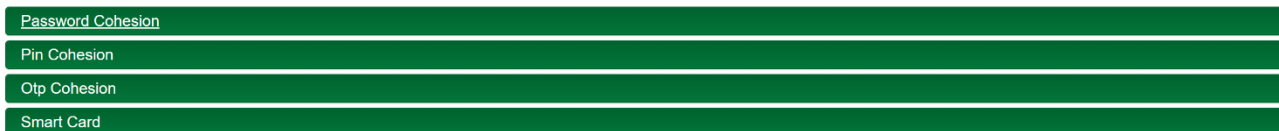
Fig. 1 Cohesion: interfaccia in modalità classica

Si informa che – in ottemperanza all'Art. 24, D.L. 76/2020 (art. 64 CAD) – dal 28 febbraio 2021 non verranno più rilasciate credenziali cohesion (PIN, Password, OTP) ad uso dei cittadini. Quelle rilasciate saranno valide fino al 30/09/2021, dopo tale data l'accesso ai sistemi sarà consentito utilizzando CNS/TS-CNS, CieID o credenziali SPID. Il PIN cohesion continuerà ad essere valido per accedere a sistemi usati all'interno dell'amministrazione dai dipendenti ed affini