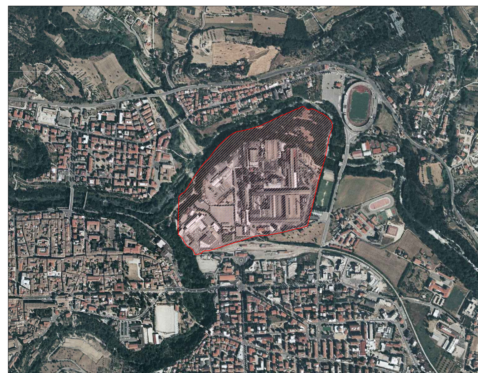
INQUADRAMENTO TERRITORIALE SU ORTOFOTO SCALA 1:10.000