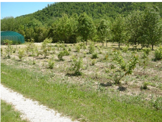
Foto 2 Castagneto anno 2014