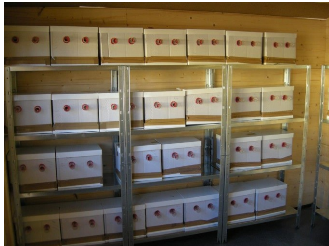
Foto 4 Raccolta galle per verifica insediamento