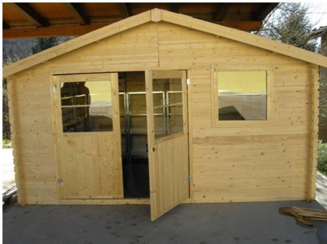
Foto 3 Struttura per stoccaggio galle

presso il centro di moltiplicazione è stata allestita anche una struttura per lo stoccaggio invernale delle galle e lo sfarfallamento degli adulti del parassitoide.