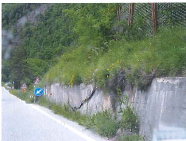
02 - Km 10+250 SP 452 – “Contessa” - Muro di Sostegno