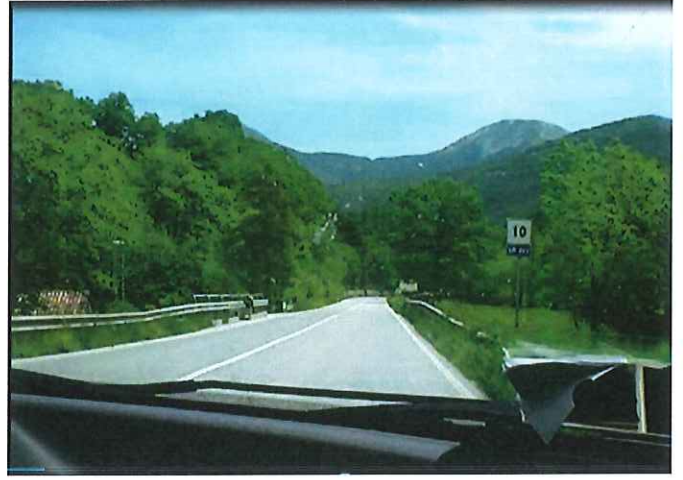
02 - Km 10+000 SP 452 – “Contessa”