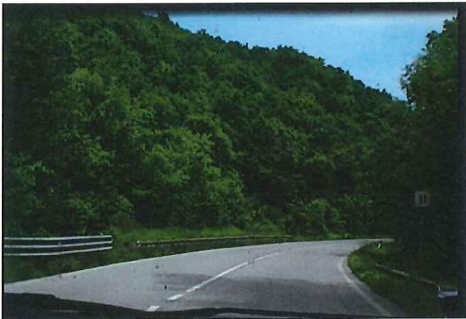
03 - Km 11+000 SP 452 – “Contessa”