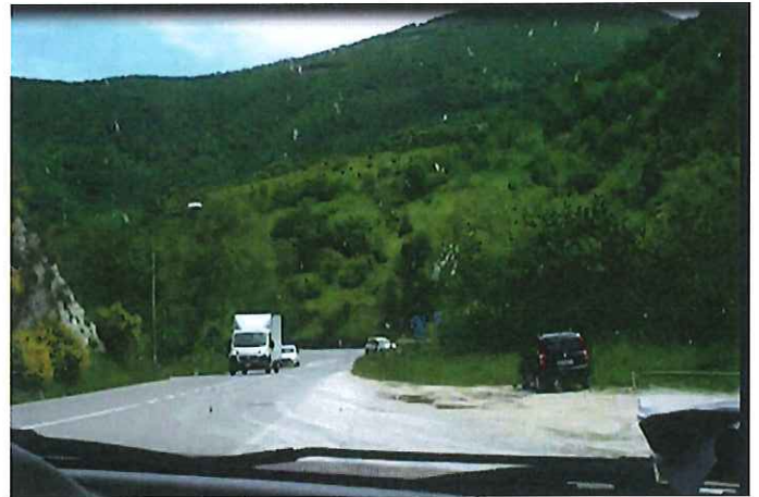
04 - Km 12+075 SP 452 – “Contessa” – Fine Tratto