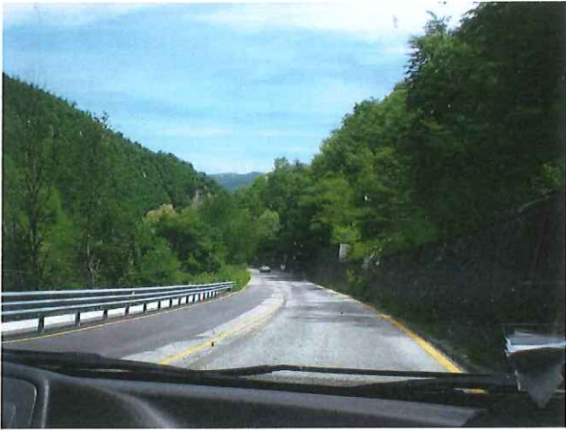
01 - Km 9+590 SP 452 – “Contessa” – Caposaldo