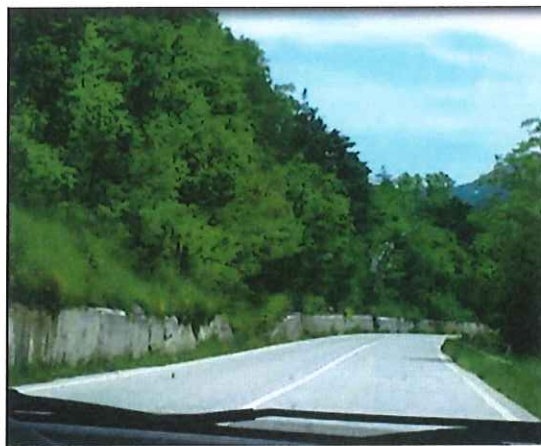
02 - Km 10+200 SP 452 – “Contessa” - Muro di Sostegno