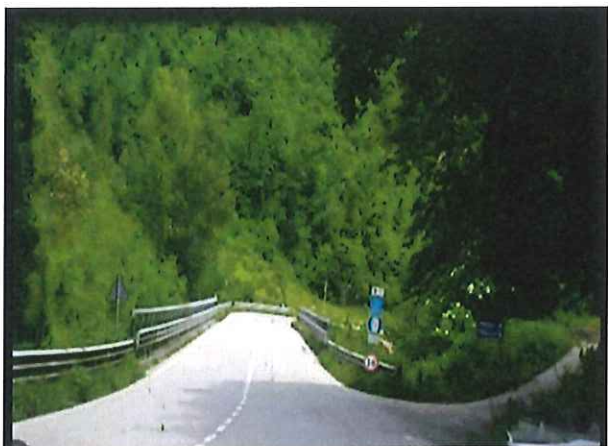
01 - Km 9+700 SP 452 – “Contessa” - Ponte Via della Fornace