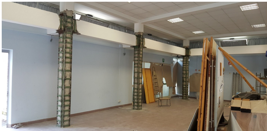
Particolare dei lavori di consolidamento