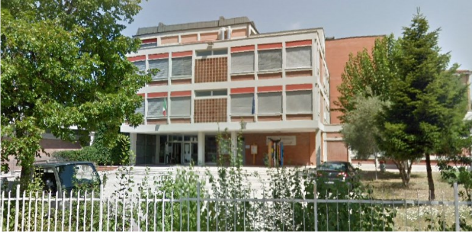
Prospetto principale edificio