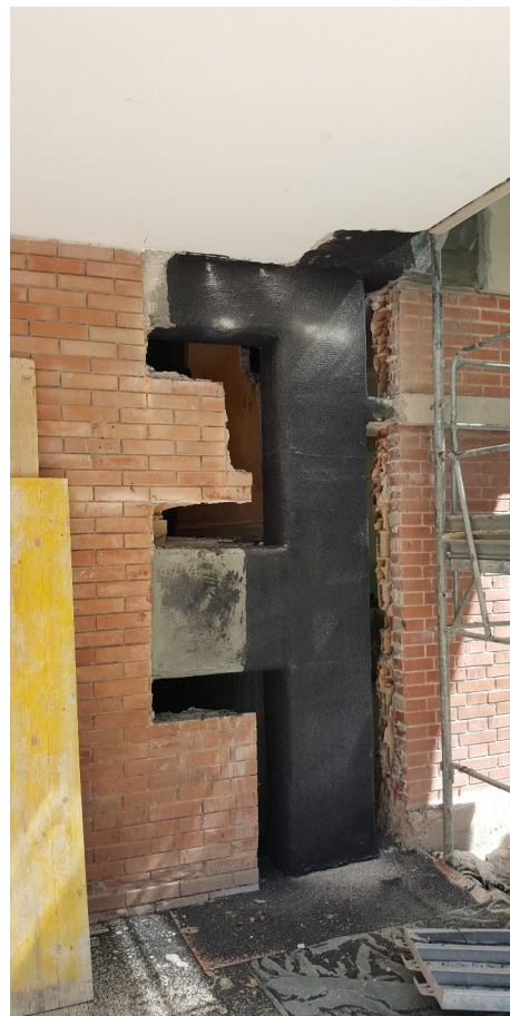
Particolare dei lavori di consolidamento