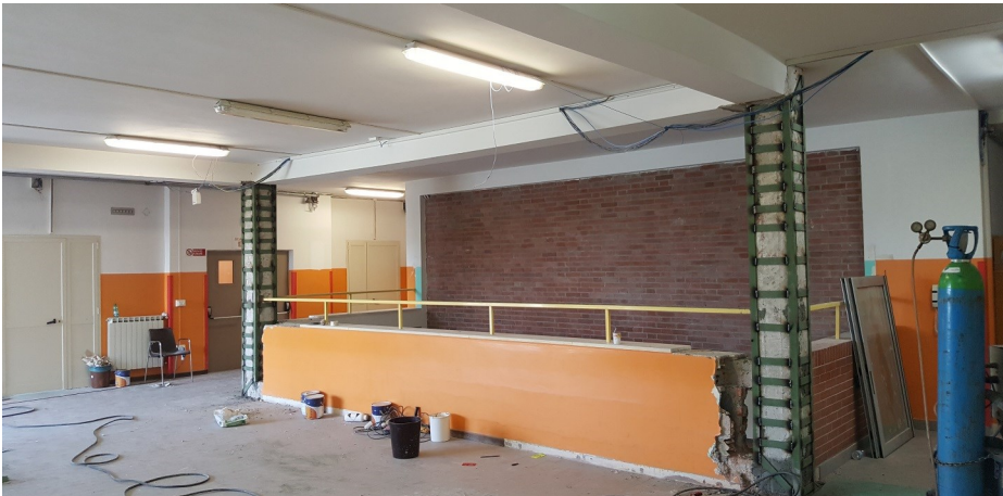
Particolare dei lavori di consolidamento