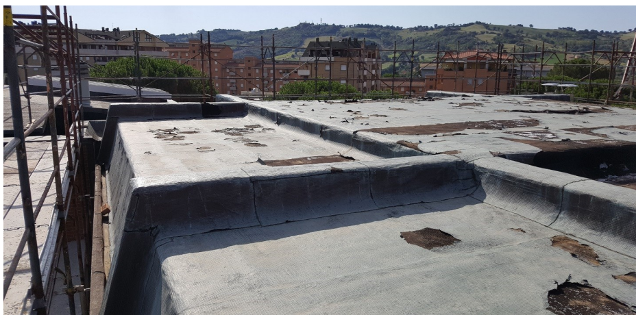
Particolare dei lavori sulla copertura