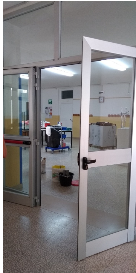
Particolare nuovi infissi