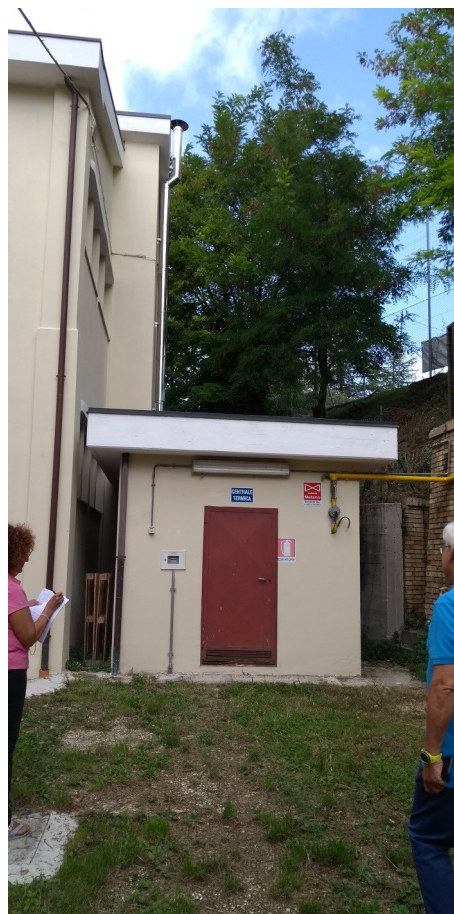
Particolare centrale termica