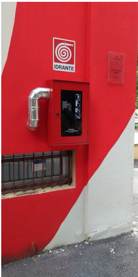
Particolare attrezzature antincendio