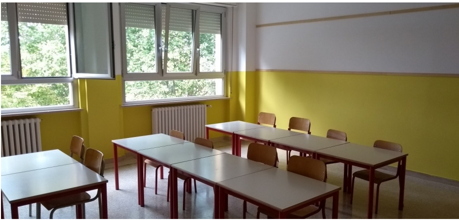
Particolare nuovi infissi