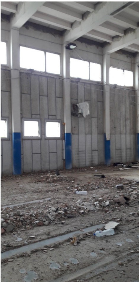
Lavori in corso d'opera