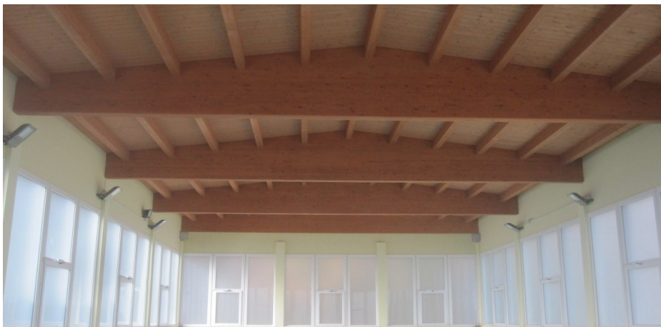
Nuovo solaio di copertura in legno lamellare a doppia orditura