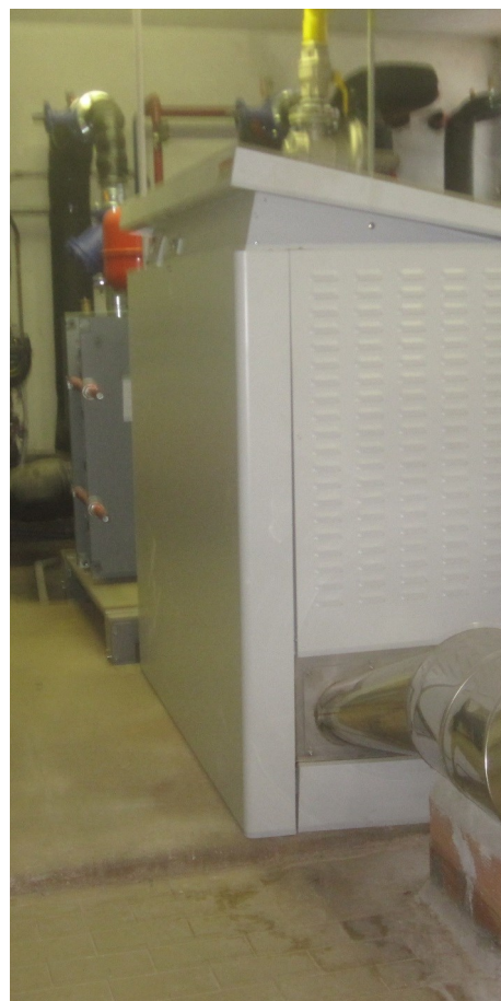
Nuovo impianto di produzione acqua calda