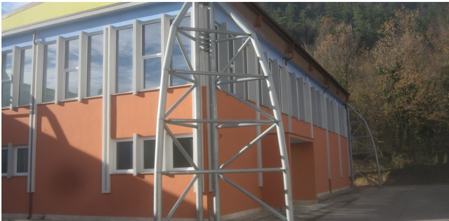
Prospetto principale edificio con evidenziato intervento di adeguamento sismico mediante strutture sismo-resistenti