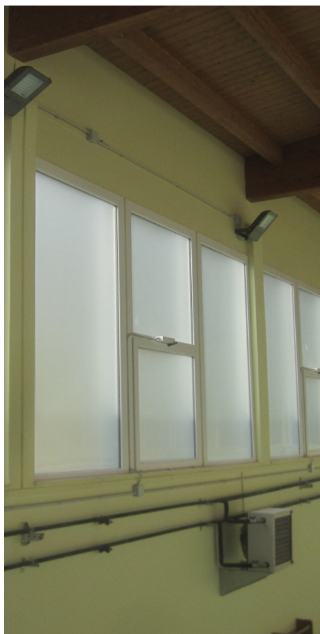
Nuovi infissi in alluminio