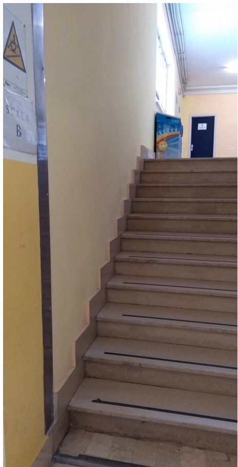
Particolare giunto tecnico