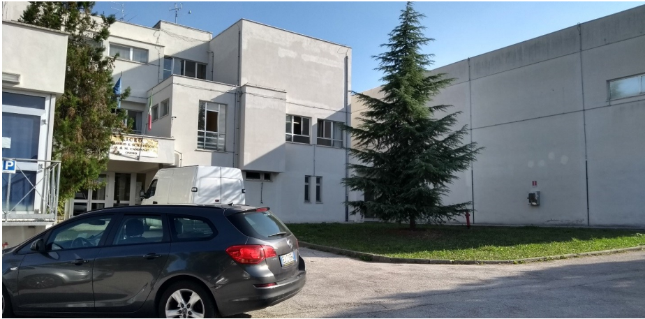
Prospetto principale edificio.