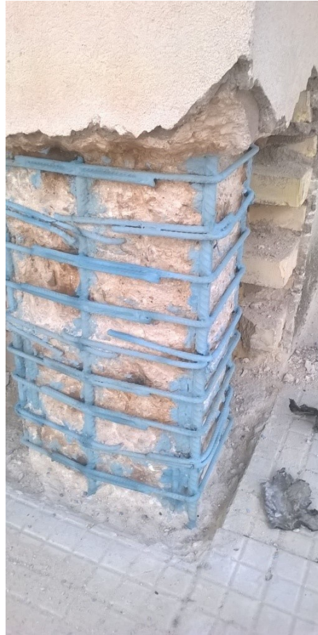
Armature intervento di allargamento pilastro e travi esistenti