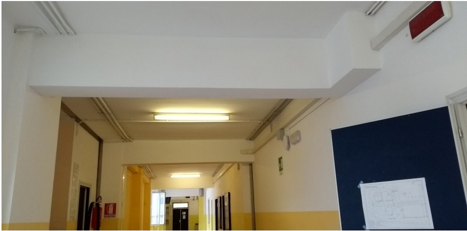
Particolare portale rinforzato