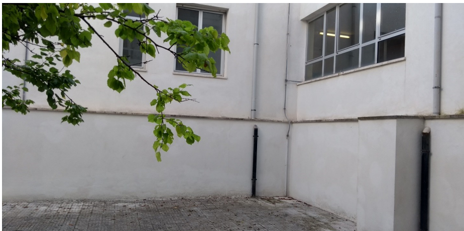
Particolare rinforzo muratura perimetrale posteriore