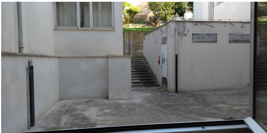
Particolare rinforzo muratura perimetrale posteriore (ex casa del custode)