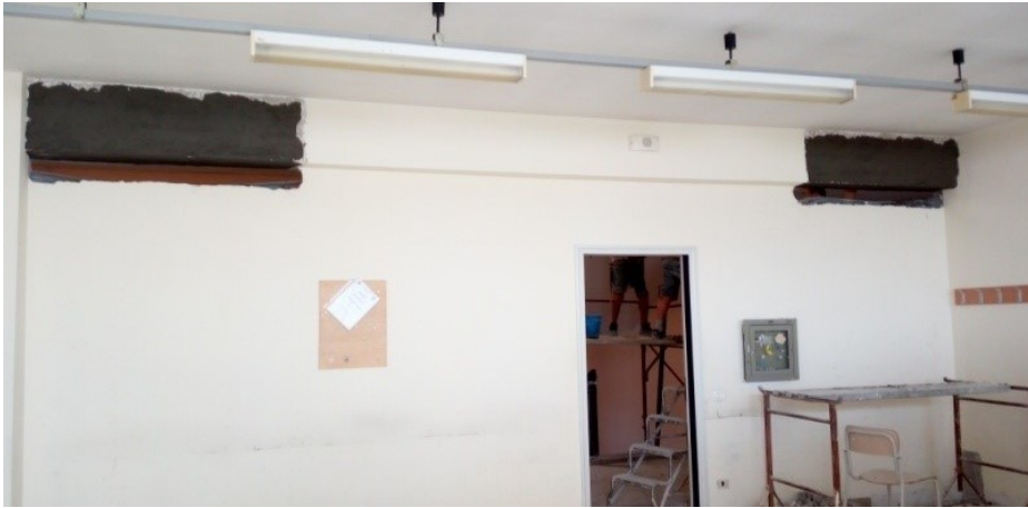
Lavori di rinforzo trave a taglio