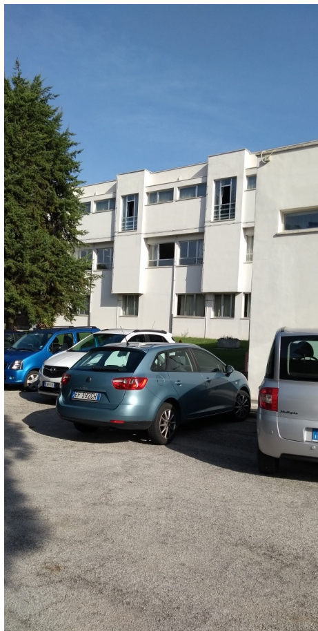
Prospetto principale edificio