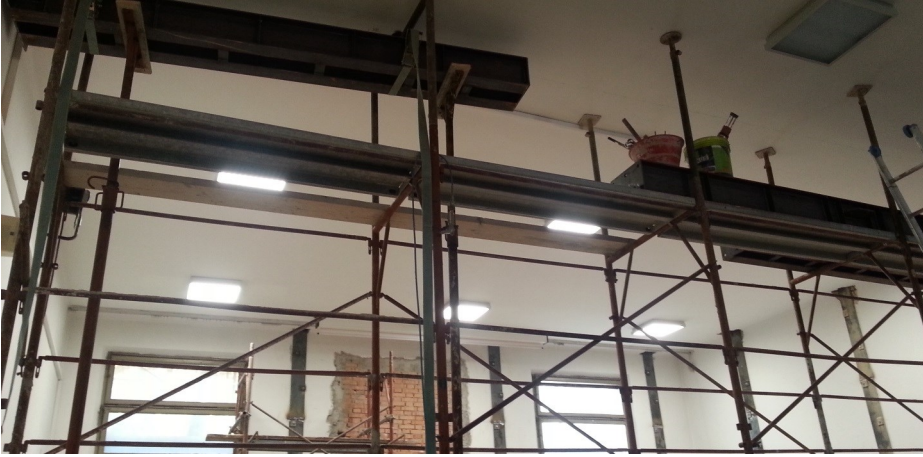
Particolare interno durante i lavori