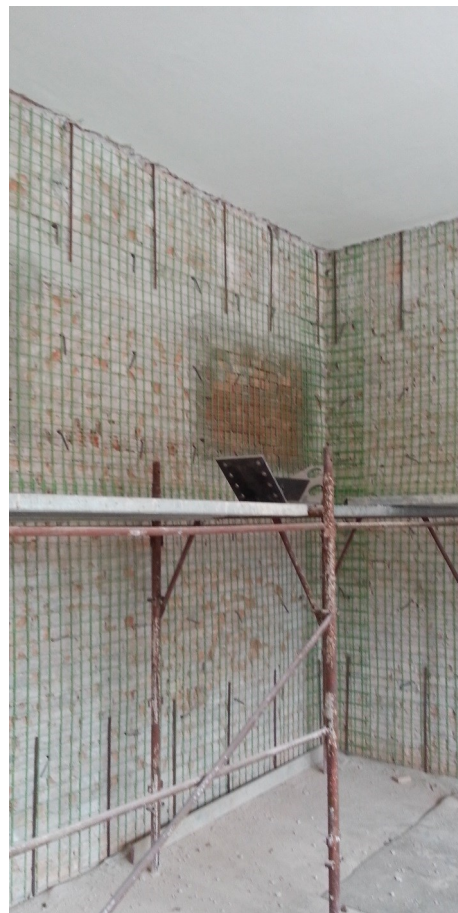
Particolare dell'interno durante i lavori