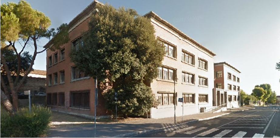
Prospetto principale edificio