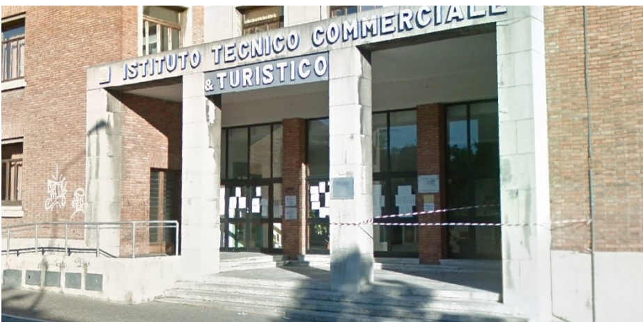
Prospetto principale edificio