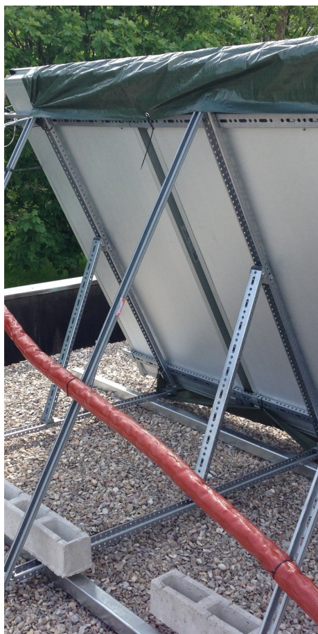
Particolare dell'impianto solare termico sulla copertura del locale spogliatoi