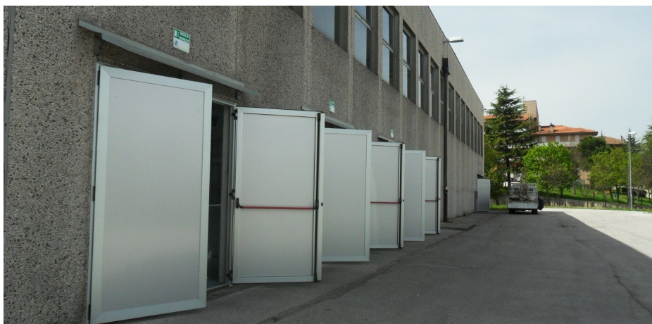
Prospetto principale edificio con particolare porte.