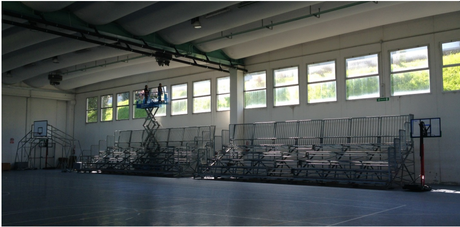
Lavori di sostituzione vetrate