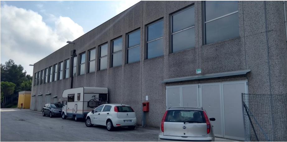
Prospetto principale edificio.