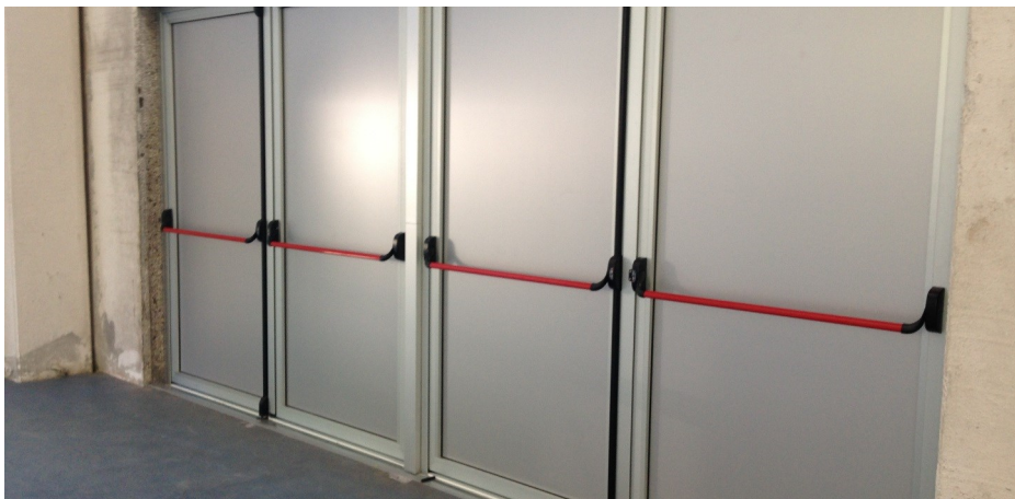
Interno palestra con particolare porte.