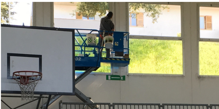
Lavori di sostituzione vetrate