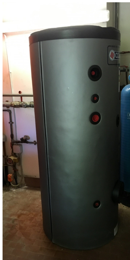
Serbatoio di accumulo