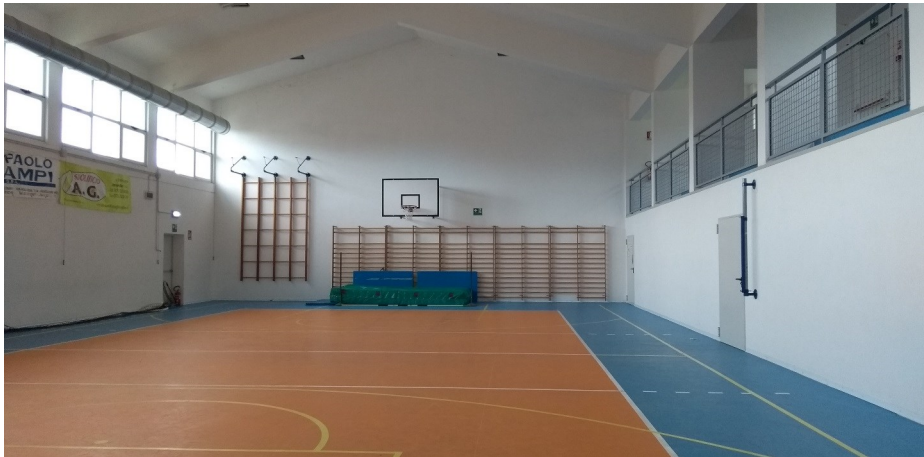
La nuova palestra.....