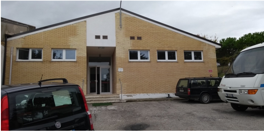
Prospetto principale edificio...