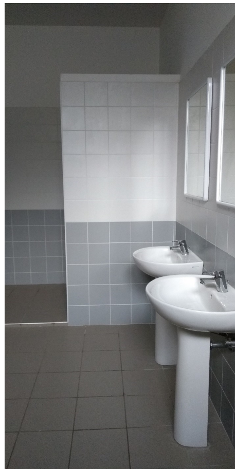
Particolar Particolare spogliatoi