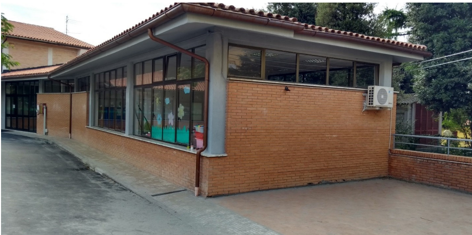
Alto prospetto corpo B