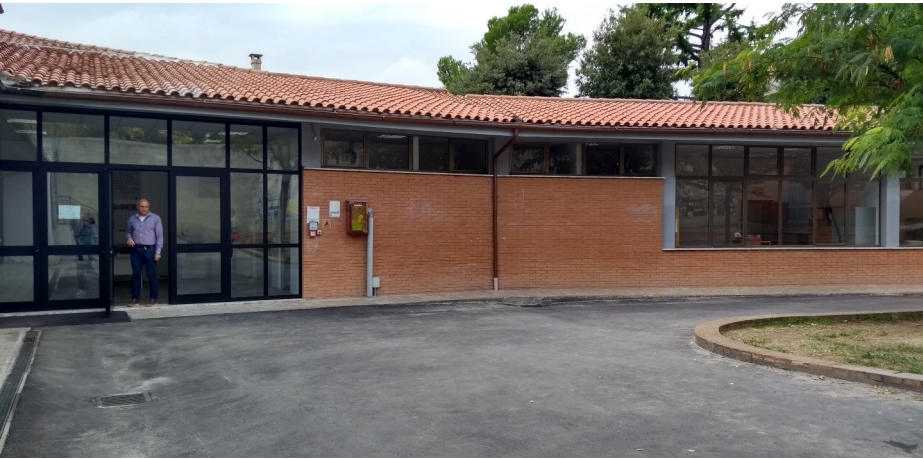
Prospetto principale corpo B