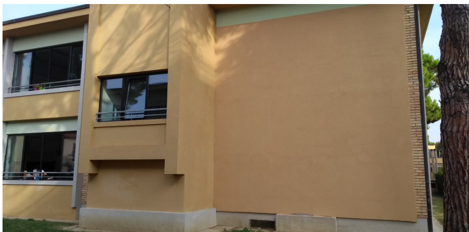
Altro prospetto edificio