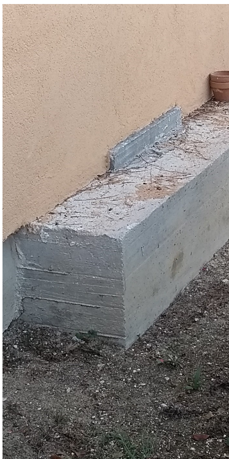
Una delle pareti oggetto di intervento.....