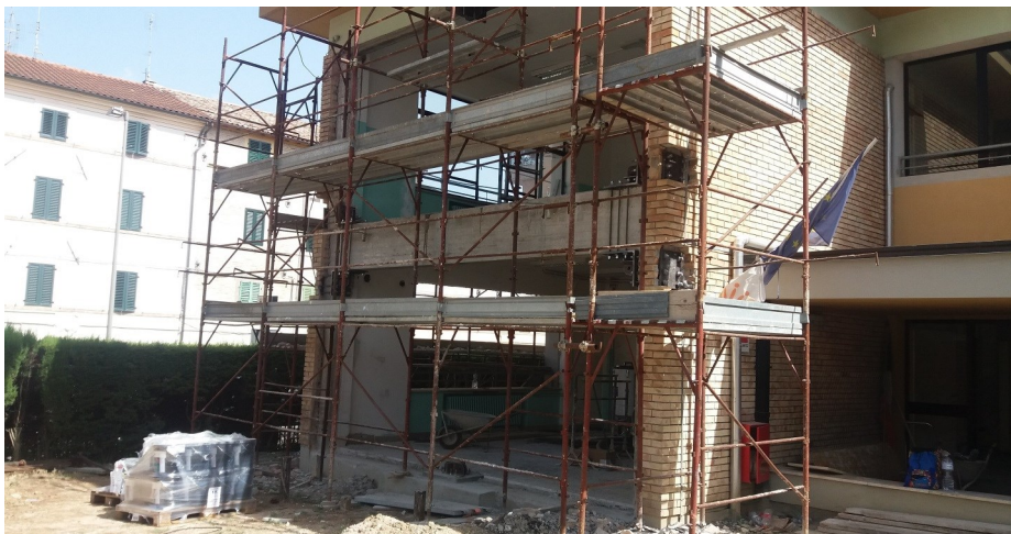
Durante i lavori: parete oggetto di intervento con piastre montate.....