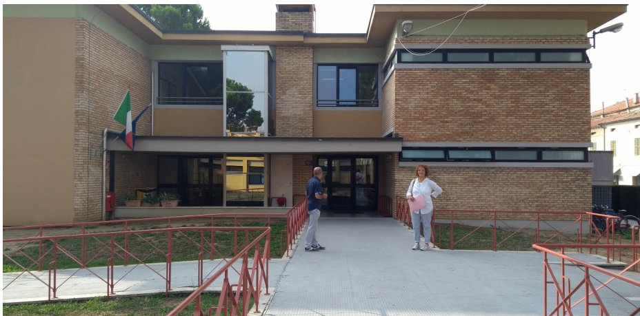
Prospetto principale edificio...