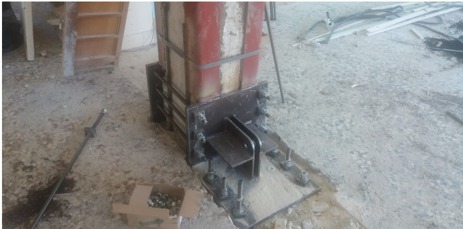
Durante i lavori: dettaglio su pilastro/trave.....