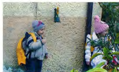
Il suono della campanella all'ingresso dell'Agrinido

Il progetto Agrinido di qualità della Regione Marche è uno dei primi in Italia. Il suo modello è stato concepito per dare la