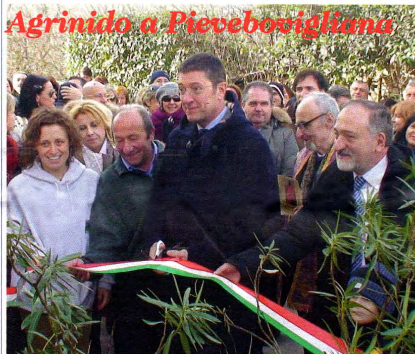
Il vice presidente della regione Petrini inaugura il primo Agrinido delle Marche (servizio a pag. 17)

isti- del un ran- e di aro, una un , da cer- esti osti- pro- simi alla orso nei bra ias- una cia- into