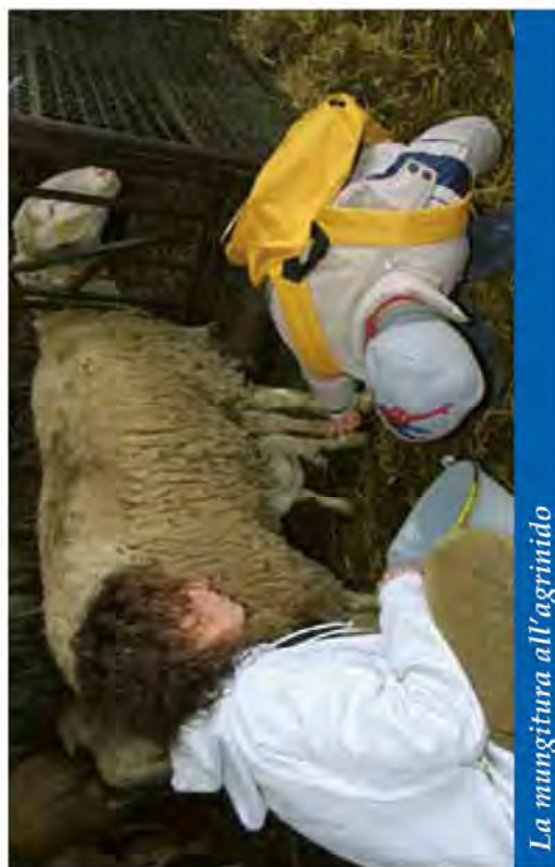
La mungitura all'agrinido