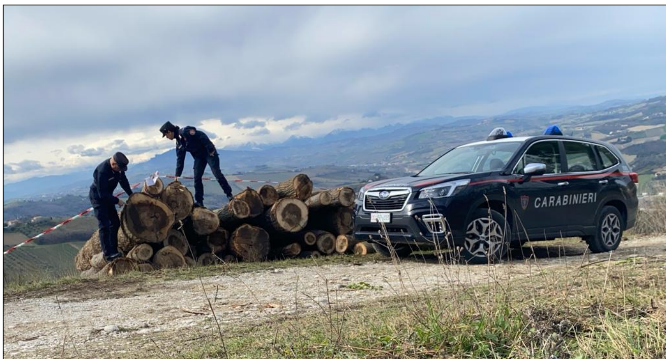
Attività di Polizia Giudiziaria – sequestro di legname

L'obiettivo è quello di salvaguardare il patrimonio forestale, di tutelare le funzioni pubbliche esercitate dai boschi e di conservare un elevato tasso di legalità nelle attività antropiche svolte all'interno dei complessi forestali. I Carabinieri Forestali, grazie alla preparazione professionale ed alle competenze tecniche possedute, di fatto esercitano in maniera quasi esclusiva le funzioni di vigilanza e di accertamento degli illeciti nel settore. La Regione Marche riconoscendo tali competenze ha attribuito con la Legge forestale regionale (art.29) al Corpo forestale dello Stato, oggi Arma dei Carabinieri con la specialità Forestale, l'accertamento delle violazioni. Inoltre, con la stessa norma, è assicurato il flusso informativo relativo al rilascio delle autorizzazione/denunce di inizio lavori delle Autorità competenti che consente ai Carabinieri Forestali di svolgere una importante attività di prevenzione.