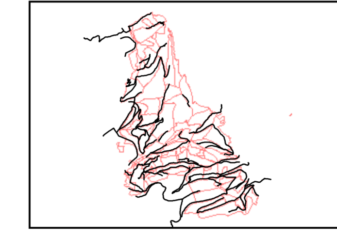
Tav. 2 - Carta degli interventi e della viabilità