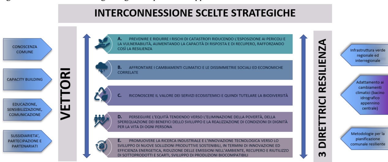
Figura. Struttura della Strategia Regionale per lo Sviluppo Sostenibile

La SRSvS individua un percorso incrementale che favorisca il dialogo con il DEFR nel rispetto delle distinte finalità, considerando che il DEFR è base per la programmazione finanziaria e rappresenta lo snodo di interconnessione fra il Programma di governo e il Bilancio esprimendo strategie e modalità di perseguimento. La Strategia, in sintesi, individua cinque scelte strategiche, affiancate dai vettori di sostenibilità, declinate in 19 obiettivi per i quali sono state individuate le azioni che concorrono alla loro realizzazione. Inoltre ha sviluppato un focus particolare sul tema della resilienza territoriale per il quale ha individuato tre direttrici di sviluppo.