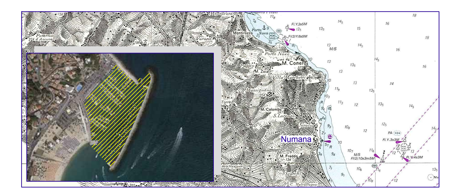
TAVOLA BATIMETRICA E PIANO QUOTATO

RILIEVI BATIMETRICI SINGLE BEAM DI PRIMA PIANTA DEL PORTO DI NUMANA (AN)