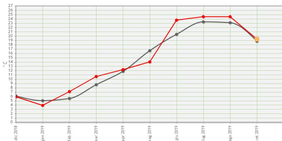
Figura 2 - Temperatura mensile - Media regionale (confronto con la media 1981-2010)

Analogamente, per quel che riguarda la temperatura, sempre nel secondo semestre, si sono potuti verificare degli incrementi di temperatura, enunciati nella nota di richiesta del supplemento di carburante agricolo.